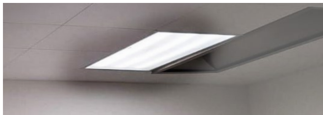
Unserer UPR-Profile nach dem Einbau am Standort unseres Kunden

Warum das ganze Gehäuse tauschen, wenn nur die Technik veraltet ist? Mit unseren passgenauen LED-Profilen modernisieren Sie Ihre Beleuchtung direkt im Bestand. Das Gehäuse bleibt, die Effizienz kommt.