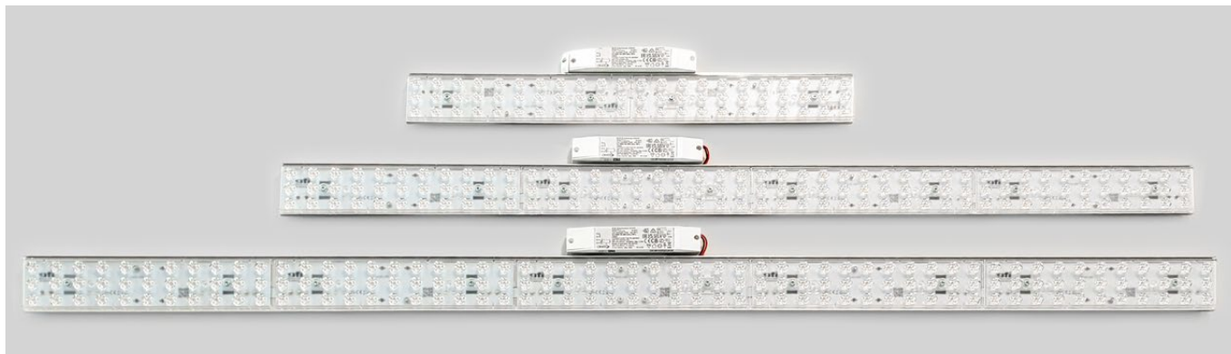
Produktfoto der Profile in den drei lieferbaren Längen